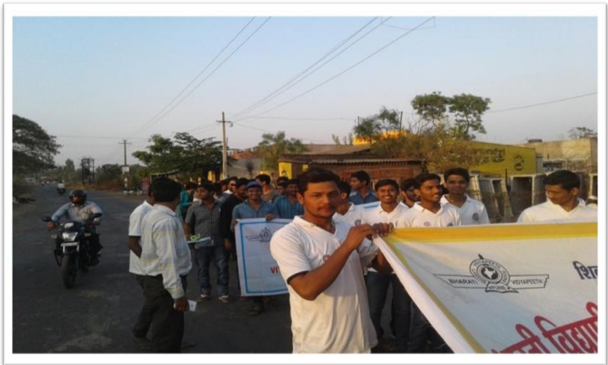
NSS Volunteers Rally at Mouje Sangaon