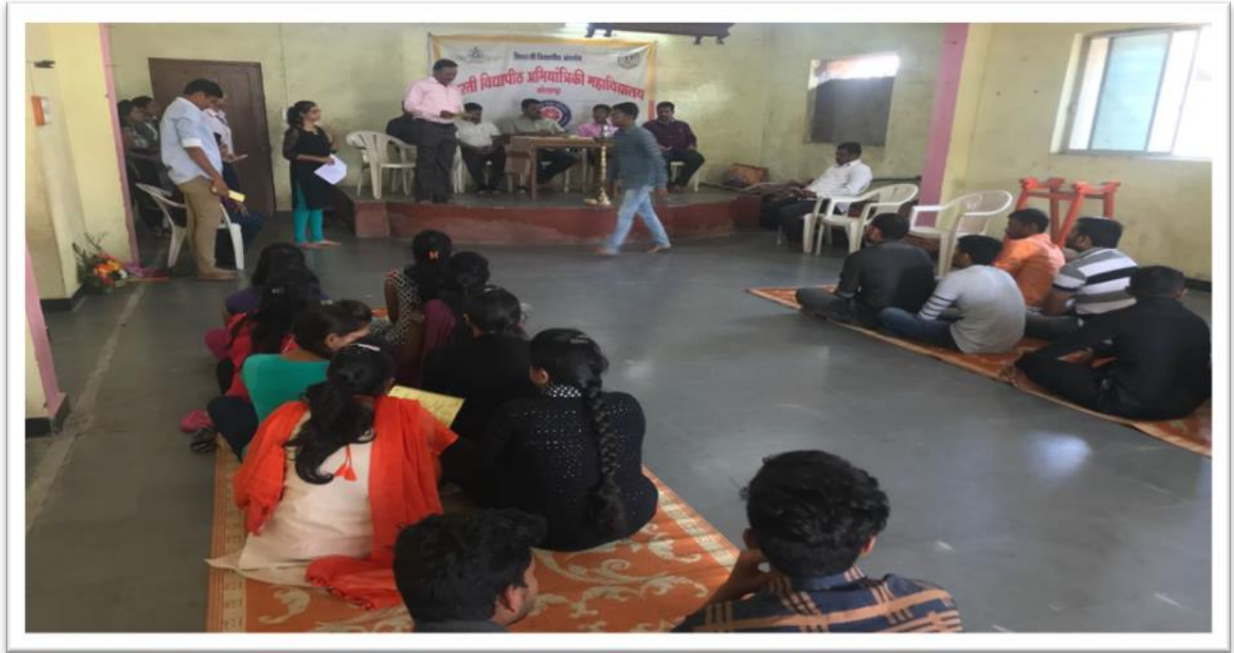
Camp Inauguration in presence of Principal & sarpanch of village