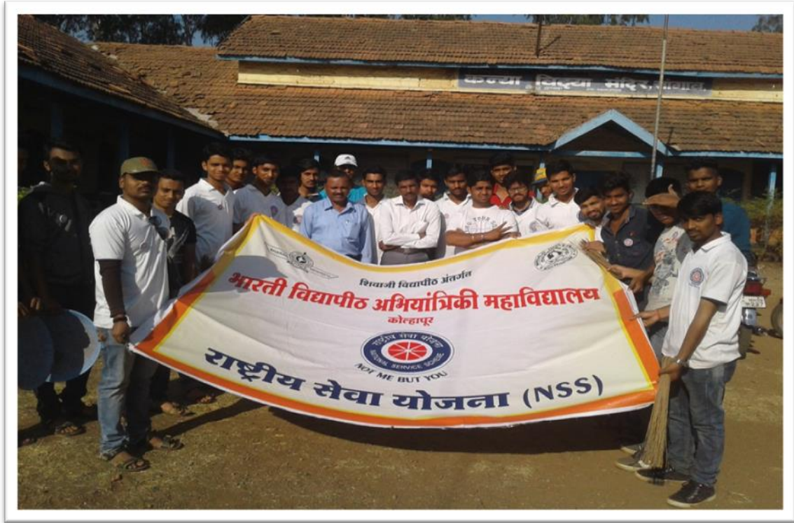
Group Photo-NSS Volunteers for Rally