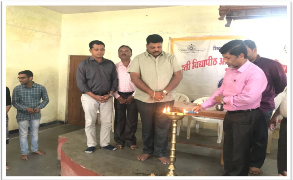
Camp Inauguration by Principal Dr.V.R. Ghorpade, Village Sarpanch & Dy.Sarpanch.